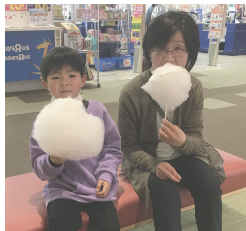
孫と佐世保五番街にて

「次の日のことを心配しすぎないよ」と言う教えを当てはめて、心が穏やかに、平安に過ごしています。皆さん、お身体にお気を付けてお過ごしになって下さい。