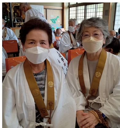
偶然に会った五重相伝の日！ 常光寺(伊万里)にて

みんな歳をとっていろんな事があります。体に気を付け、残りの人生を楽しく元気に過ごしましょう。またいつか逢えるのを楽しみにしています。